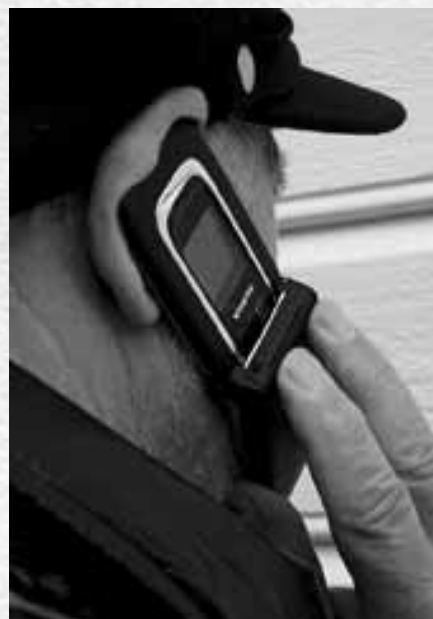
Veldig viktig melding???

Skulle liknende unders kelser bli gjennomf rt om andre moderne tek-