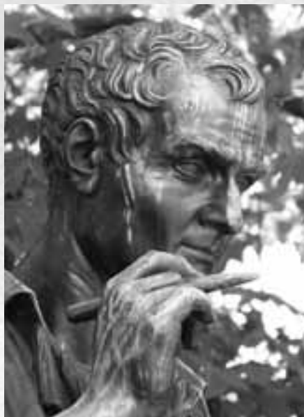
Statue av Jean Jacques Rousseau.

Fram gjennom 1800-tallet ble det stadig mer vanlig å drøfte muligheten for at ikke bare kultur og menneske, men at faktisk alt på jorda utviklet seg. Da Charles Darwin offentliggjorde «Artenes opprinnelse» i 1859 ble evolusjonsteorien derfor i mange miljøer mottatt som en storslått bekreftelse på menneskets rett til selvvelge sin skjebne: den kirkelig-føydale maktstrukturen fra det førmoderne var så si i strid med naturen selv, og troen på individets evne til vekst fikk en mektig bekreftelse.