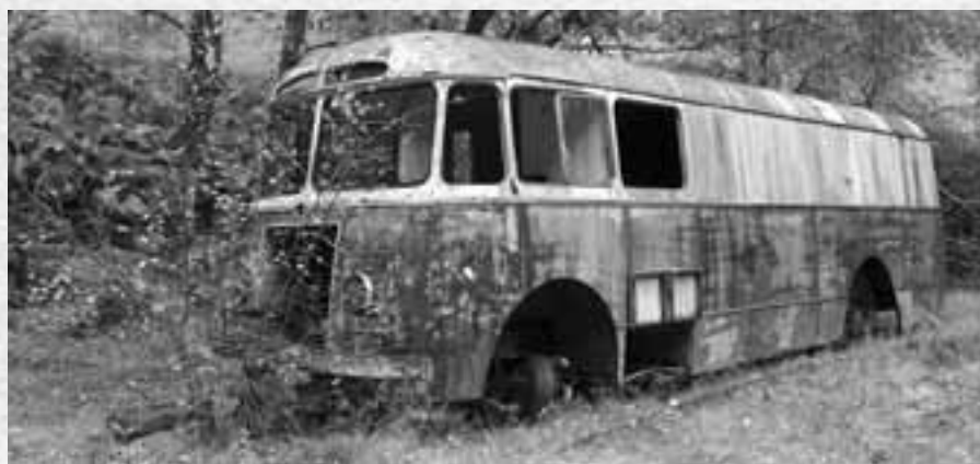
Minne etter flomkatastrofen i Simadalen 1937.

Da regningen kom, ble mannen forundret over den høye prisen for den korte tiden arbeidet tok.