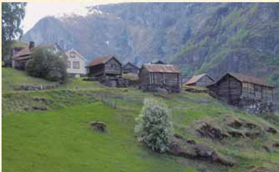
Otnestunet, Aurland.