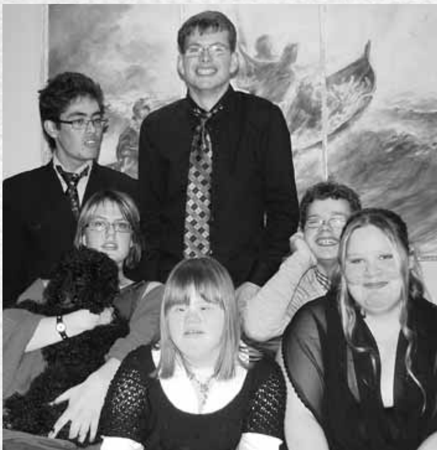
Framskolen i festantrekk.

– Vi har sett behovet for at flere utviklingshemmede trenger hjelp i en overgang fra familiesituasjonen til