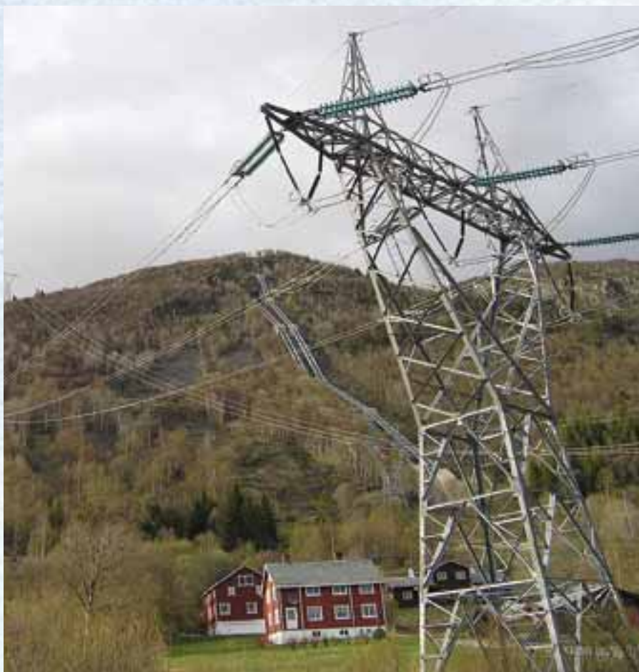
Natur og unatur.

Den tredje fare i teknologien - at det frister oss bort fra den virkelige til den virtuelle verden - presenterer oss med nok en utfordring som må bli