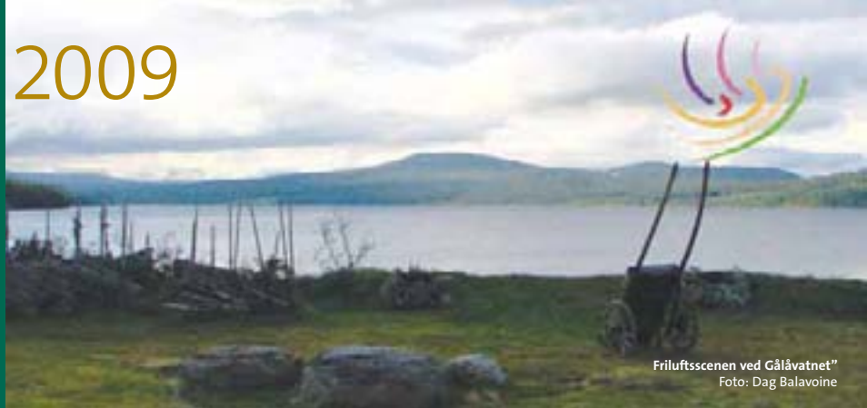
Friluftsscenen ved Gålåvatnet"