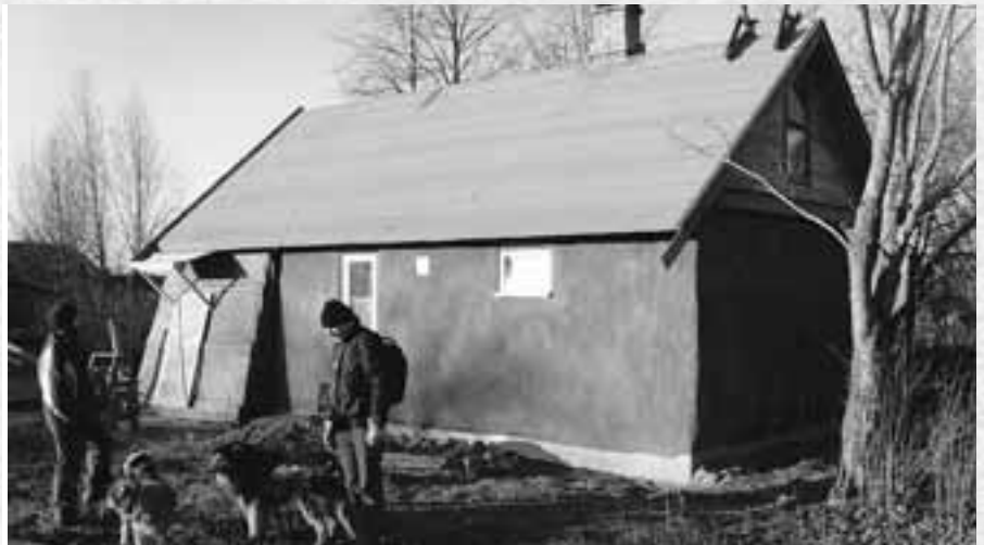
Den nye banja'en (russisk badstue) med damprom, dusjrom og hvilerom og stor, vedfyrte badstueovn.