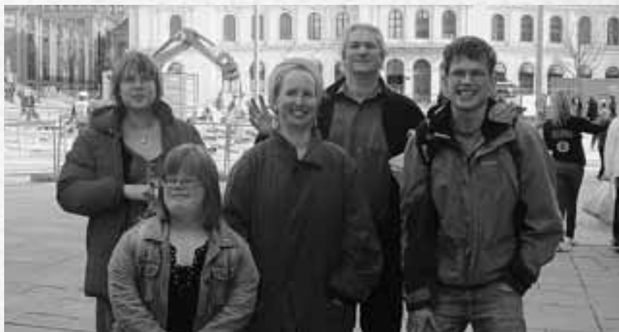
Førsteåret på Oslotur.

– Der l rer de om hvordan vi skal forholde oss til andre. Og hvordan vi behandler kj rester annerledes enn venner.