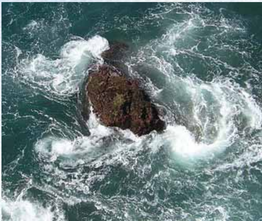
Elementene møtes.

I dag er evolusjon uløselig knyttet til Charles Darwins navn. Men