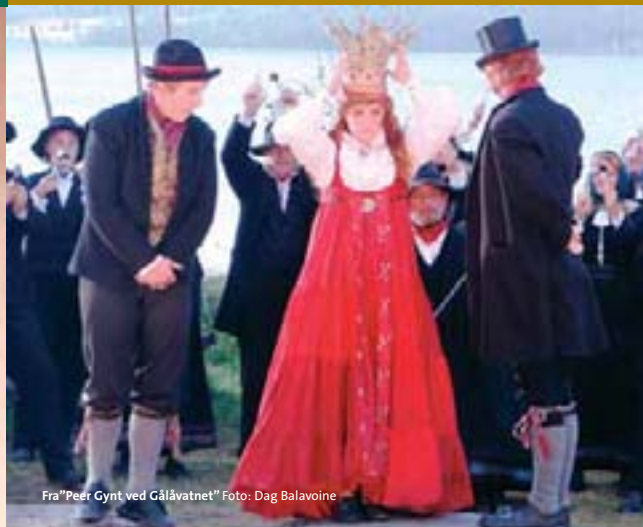
Fra "Peer Gynt ved Gålåvatnet"