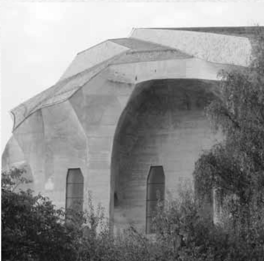
Detalj fra Goethanum, Dornach.

Forberedelser for denne konferansen er viktige. Landsbyliv anbefaler dens lesere, både enkeltpersoner og grupper i Norge selv å delta eller oppmuntre deltakelse blant sine venner. Å danne fellesskap ut fra en moderne bevissthet, enten det er arbeidsfellesskap, studiefellesskap eller bofellesskap er utfordrende men svært viktig i vår tid.