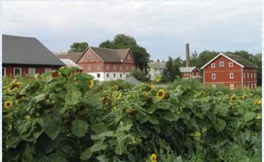
Solsikkene trives på Rotvoll.

Representantskapsm t p Vidaråsen i november i år vil forhå-