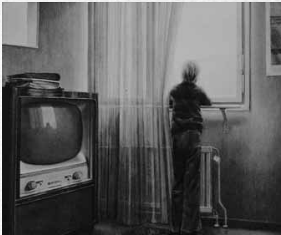
Gutten og tv'en.

I motsetning til "gammel teknologi" av pre-digitale alder, da maskiner var store, tunge og uh ndterlige ting, har de n blitt bemerkelsesverdige sm og dermed fysisk mye n rmere oss. Dessuten inneholder de viktige personopplysninger - adresser, dagb -ker, telefonnummer - og de er selv en viktig kommunikasjonskanal med andre. Sherry Turkle kaller disse for "intime maskiner». Ikke bare er de sm og lette, men de kan ogs gi oss f lelsen av at de er p en m te forlengelser av oss selv.