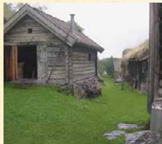
Otnestunet.