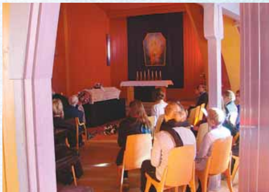
Fra begravelsen.

Johannes hadde vakre hender. Da jeg spurte om jeg kunne få ta bilde av dem, kunne han ikke forstå at de var interessante. Men da jeg fortalte om hvilken betydning de hadde hatt for de mange mennesker han hadde viet, døpt og velsignet, så han på sine hender med ny interesse.