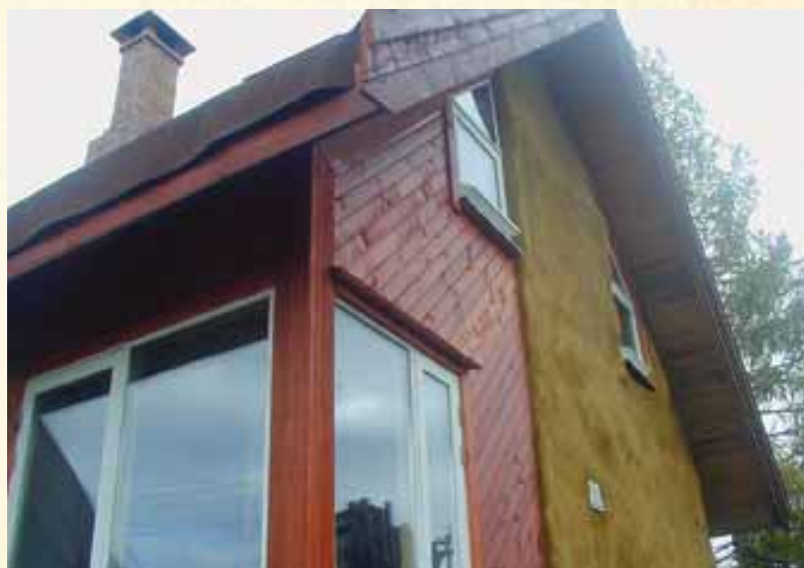
Gjestehuset på Ryskovo, med halmvegger, leirepuss og overnattingsplass til 10-12 personer.

Vårturen har hele tiden vært vår mest populære. I tillegg til skolene, prøver vi også å holde av noen ekstra plasser fordi vi synes det er en flott kvalitet at det også er andre med. Samtidig tar mange kontakt med oss for å melde seg på – og plassene blir dessverre raskt opptatte.