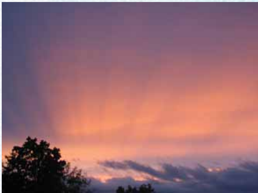
Lysets verden.