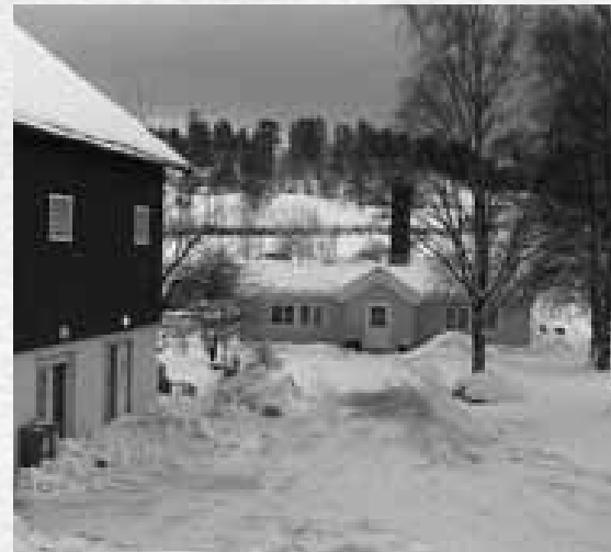
Rotvoll – utsikt mot St.Hanshaugen.

N er det slutten av april. Nydelig v rstemning, fuglekvisper og solskinn gir v ronna et paradisisk preg. Det finnes et omr de vi har forpaktet, p 70 m l, i tillegg til de 20 m l, som eies av Stiftelsen Rotvoll Gård. Det meste av dette benyttes til beiteomr det for et par ponnier og sauene. De brukes og stelles også av elevene på Steiner-skolen her på Rotvoll. I helgene og i