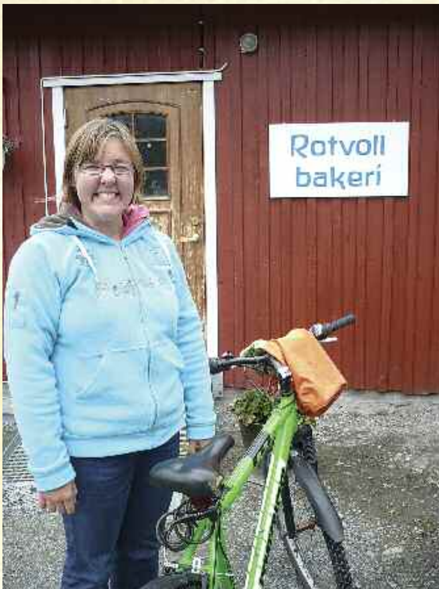
Brødlevering til lunsjrommet og husene skjer med sykkel.