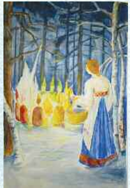
Veggmaleri av Turid Nøkleberg Schjønsby.

Solveig Nagell hadde en sterk overbevisning om at selv de mest tilbakestående barn hadde utviklingsmuligheter. Med kunnskap, interesse og fantasi, gav hun en etterhvert voksende flokk med barn opplæring og næring for hode, hjerte og hånd.