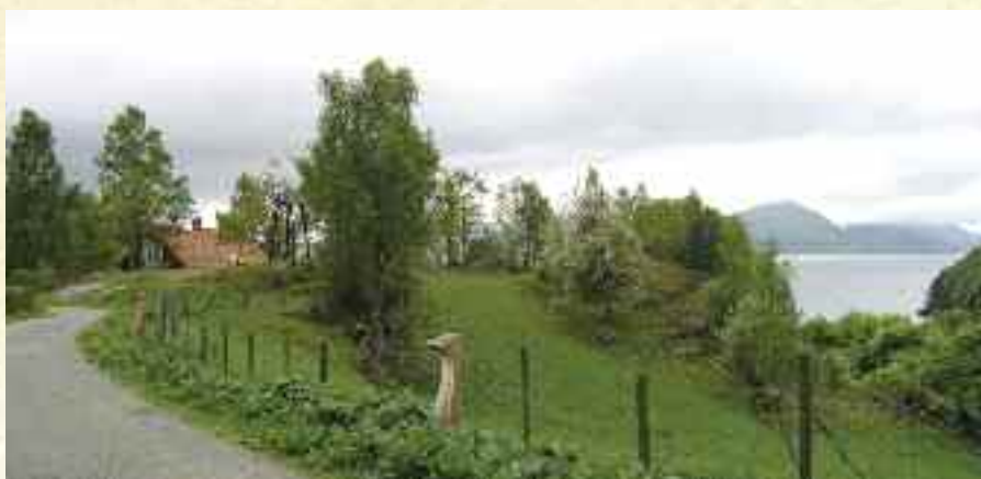
Fra Hogganvik.

Antroposofien lærer at mennesket og verden har et åndelig opphav, og at mennesket har evne til å tilegne