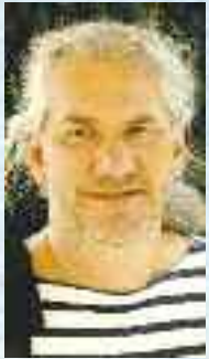
Dag Balavoine

16 deltagere fra Steinerskoler, Steinerbarnehager og 7 deltagere fra Camphilllandsbyene i Norge har siden begynnelsen av 2010 tatt del i Sea-Quintakurset som holdes av Sea Quinta Norge på Bærle i Oslo. Det er 12 samlinger over en 2 1/2-års periode.