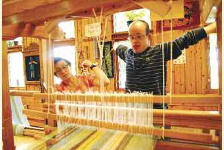
Fra vevstuen.

Granly har gjennomgått flere offentlige sosiale reformer. Vi har ikke passet inn i reformtankene, og vi