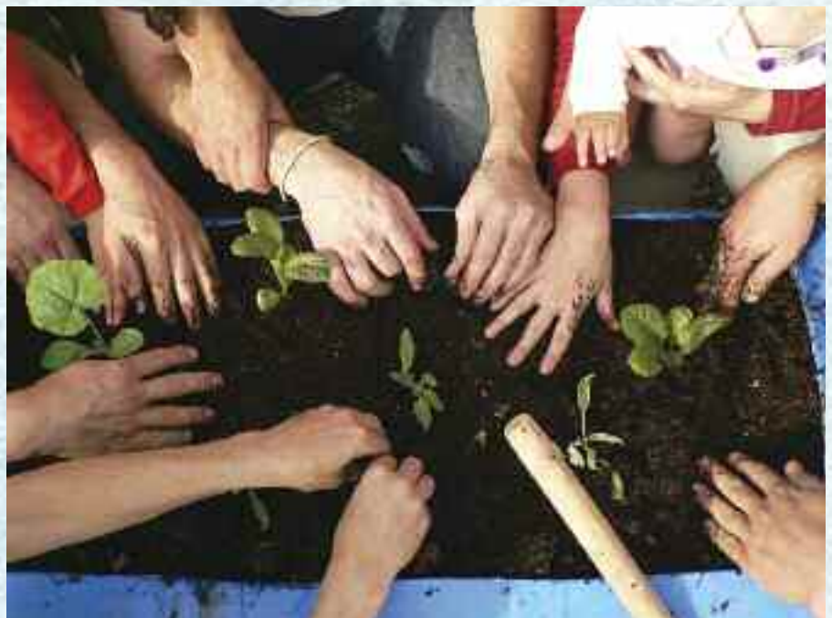
Håndlaget fruktbar jord.