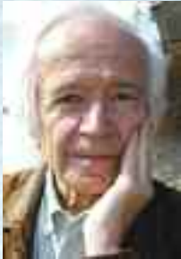
Nils Christie.

Første akt: En ny utleieindustri er i ferd med å oppstå: Utleie av livmor. Ta med et befruktet egg til en kvinne i India, få det plantet inn, det skjer under trygg medisinsk kontroll. – en kontroll som fortsetter gjennom hele svangerskapet.