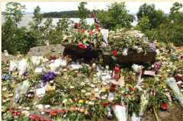
Utøya i bakgrunnen.

Vi var midt oppe i samling av stoff til denne utgaven av Landsbyliv da nyhetene om bomben i Oslo og skytingen på Utøya kom. Tragedien satte sitt preg på arbeidet vårt, og det strømmet til med eposter fra hele verden og fra våre lesere. Vi siterer et utdrag fra et slikt brev: