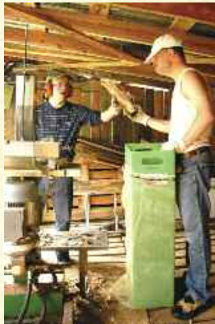
Samarbeid om vedkløyving.

Vevstuen benytter ull, bomull, og lin som råstoff. Det veves stoffer som forvandles til duker, håndklær, gardiner, kosedyr og klær.