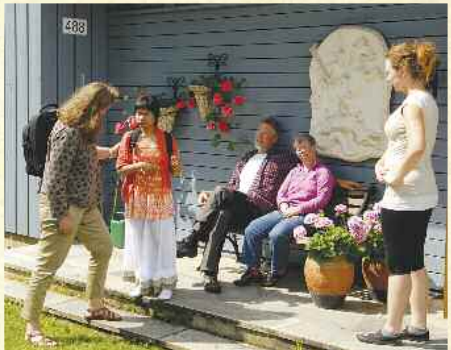
Sosialt fellesskap.