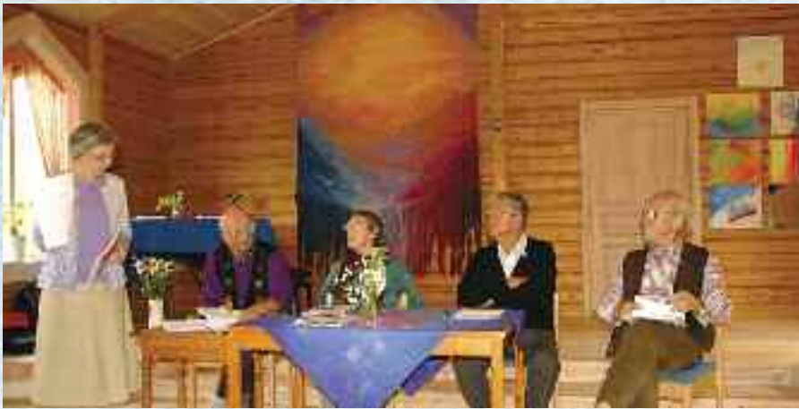
Fra representantskapsmøtet på Solborg.