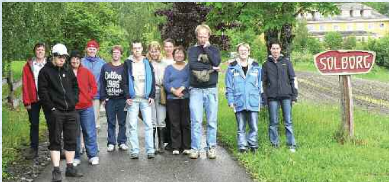
To Landsbyliv skriveverksteder treffes på Solborg.

Gruppen fra Grobunn kom 11:30, og først drakk vi kaffe og te sammen, mens vi pratet litt om hva de på Grobunn gjorde og om Peer for Alle.