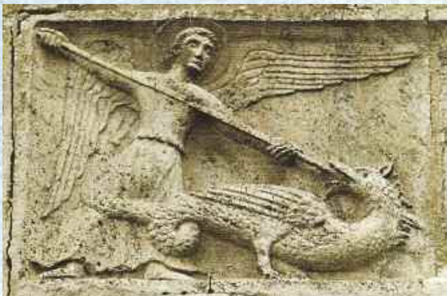
Relieff fra 12. - 13. årh., Italia.

Kanskje du spør i angst, udekket, åpen: Hva skal jeg kjempe med hva er mitt våpen?