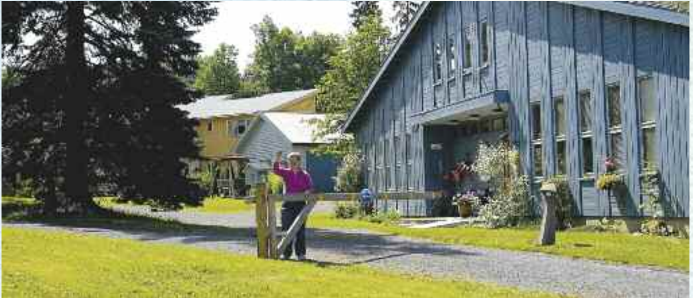
Velkommen til Granly.