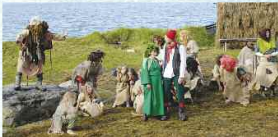
Gåå 2011.

NEB: – Takk for at vi fikk intervju deg, Annlaug.