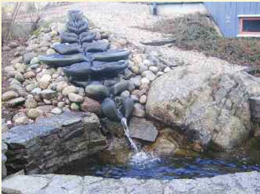
Flow Form på Vidaråsen.