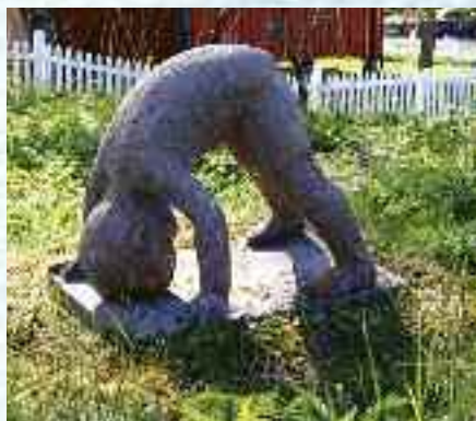
Skulpturen «Verden fra ny vinkel», av Astrid Dahlsveen.

E-post: rigmor.skalholt@gmail.com eller tlf 61160262 eller 95942750.