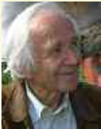
Nils Christie

Kanskje var han 16 år gammel. Aldersgrensen var 15 dengang. I dag ville han vel vært elev ett eller annet sted, kanskje i fare for å bli diagnostisert som en med ADHD – Attention Deficit Hyperactive Disorder. Det antas av noen at vi har to slike i hver skoleklasse i Norden. Og tallet øker stadig. Fint å få dem diagnostisert, da får skolene mer ressurser til å mestre dem. Av og til lurer jeg på hvordan man på seilskutenes tid skulle fått ungdom opp i stormasten med et mannskap testet og rensket for ADHD-folk.