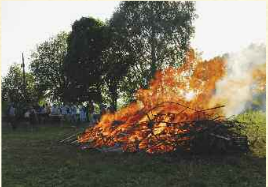
St Hansbål på Solborg.

I vår tid står vi overfor et valg: enten la oss drive med i den felles flod av media og underholdning, eller vi kan forsøke å forme vårt daglige liv mer bevisst. Dessverre er det slik at det meste av det som i dag tilbys, bidrar til å utviske det individuelle. Der vi kan begrense de kollektive påvirkninger, kan noe individuelt komme frem i det nære rom med familie og venner. Våre små bidrag til en be-