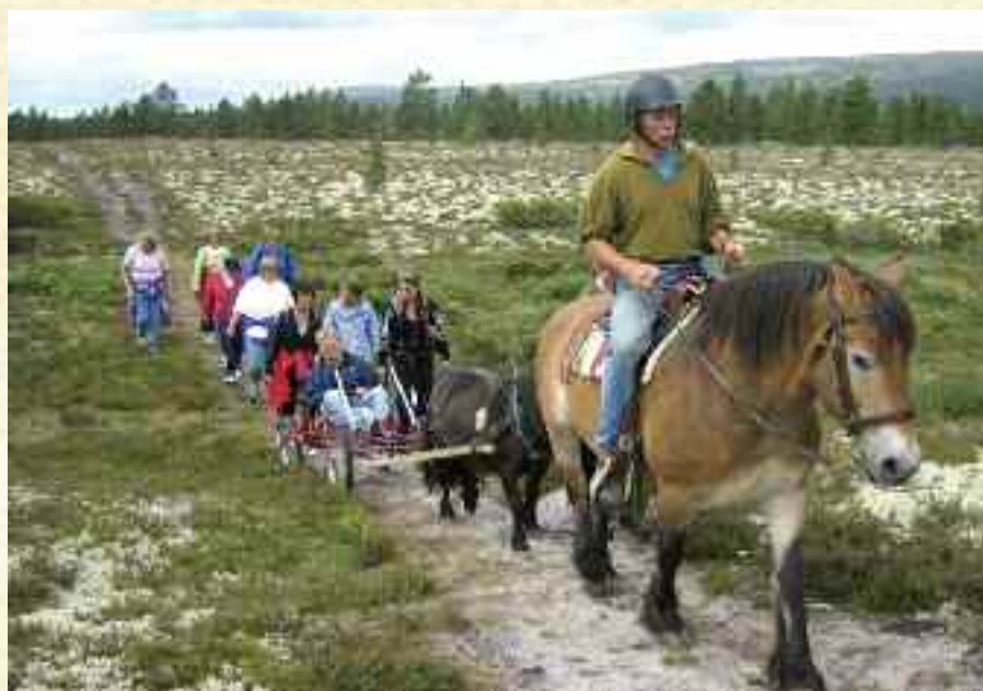
Frå Fjellheimen i 2006.