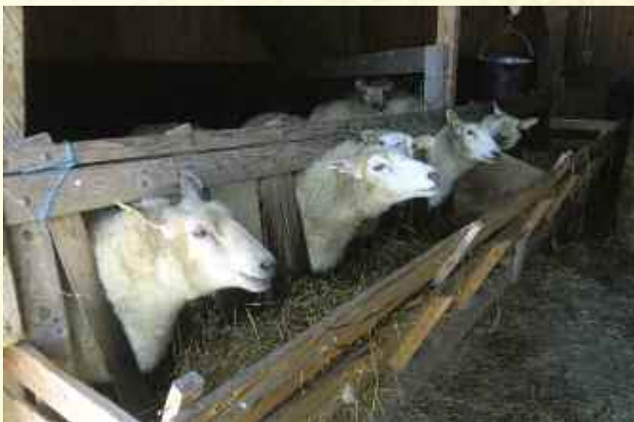
Fra gården på Vidaråsen