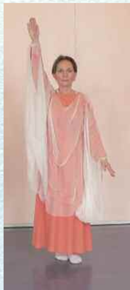
Fra Eurytmihøyskolen i Oslo.

Teksten er basert på informasjonststoff fra Eurytmihøyskolen i Oslo. Red.