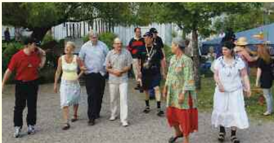
Kveldsstemming på Staffansgården under Delsbofestivalen

På lørdag var det utflukt. Etter frokost møttes alle ved idrettsplassen. Det var flere utflukts tilbud: Å reise til Hudiksvall eller å ro en spesiell type kirkebåt. Det var også mulig å gå på tur eller delta i kunstneriske aktiviteter. Vi fra Vidaråsen ble med en stor gruppe som dro til Jærvzoo, en