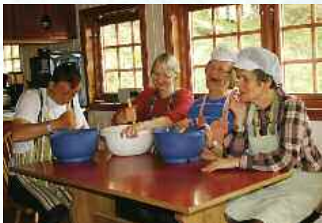
Samarbeid på kjøkkenet, Helgeseter.