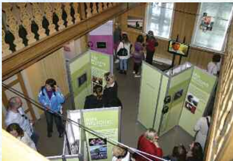
Alle bilder: Fra åpningsdagen hos Bymuseet i Bergen.

Utstillingen og nettstedet har som utgangspunkt at fortellingene om om-