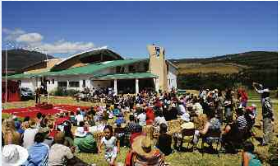
Markedsdag på Camphill

Sirkusartistene skapte stor begeistring hos de flere hundre store og små som var møtt frem. Det ble sjonglert, gjort akrobatiske kunster og hopp gjennom flammer. Spesielt var klovnene populære. Akrobatene avsluttet med å danne en pyramide hvor fire av de små tilskuerbarna ble heist opp i pyramiden. Noen timer senere var det barnas tur til å lage sirkus. De hadde på forhånd fått noen dagers undervisning av "proffene" og lånte