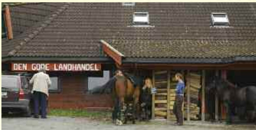
Butikken på Solborg.

Opgavene mine var å telle penger, ta imot og sette inn Helios varer,