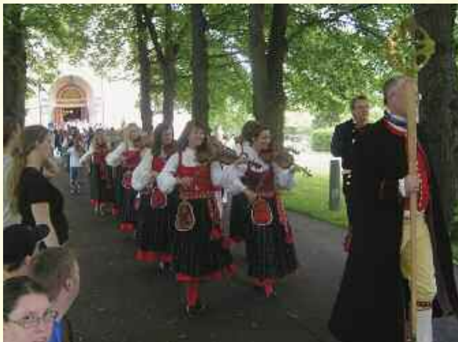
Folketoget startet fra Delsbo kirke.

Alle deltakere fra Norge vil takke Staffansgården folk for å ha organisert så fin festival, takk for å ha gitt oss en fin opplevelse og en fin ferie.