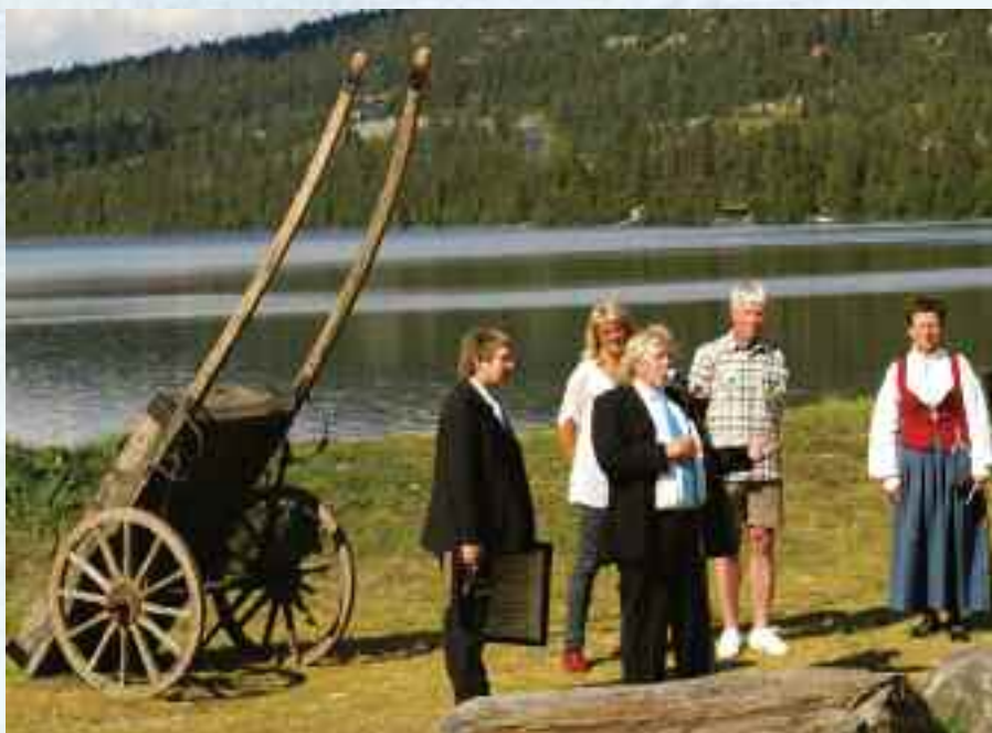
Fra utdelingen av Peer Gynt Prisen 2010.

Igjen er Landsbyliv på Gåå i Gudbrandsdalen. Denne gangen er det ikke for å være med på "Peer for alle-festival", men for å overvære årets Peer Gynt-prisutdeling!