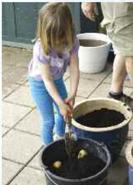
Setting og innhøsting av poteter.