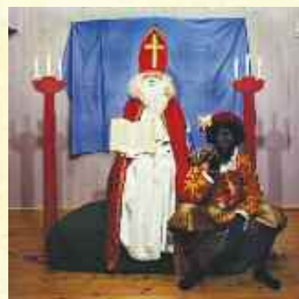
They fairly pour warmth into him

nikken gir arbeidene et særegent uttrykk, som kombinerer elementer fra digital bildeproduksjon med før-fotografiske teknikker. Paul var avbildet på omslaget til siste nummer av Landsbyliv.