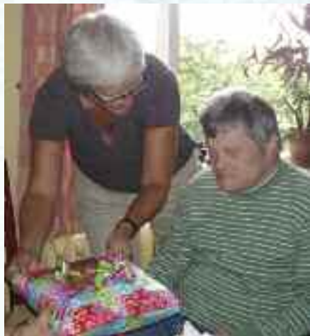
Liv og Lorentz

Hanefar som går så stolt rundt sammen med hønene ble født her i hønehuset en gang. Rigmor og Veronika var "jordmødre" den gang fordi de andre hønemødrene var i Sverige på Midsommersstevne. Kyllingen vår ble døpt Bibbi, men tiden gikk og det viste seg at det nok var en