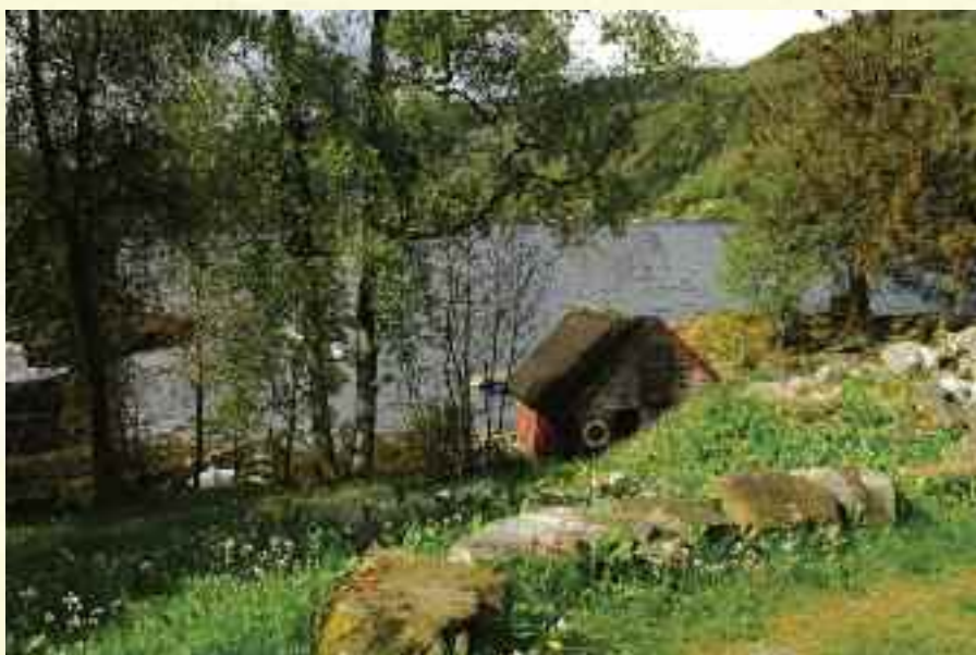
Idyll ved Sørfjorden

Rostadheimen Bo- og arbeidsfelles- skap er et snart 50 år gammelt sam- arbeidsprosjekt hvor alle på stedet er viktige medspillere.