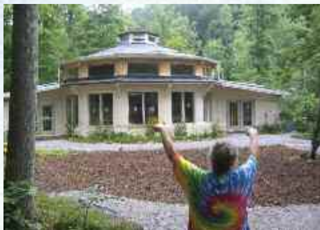
Felleshuset i Earthaven Ecovillage, USA

"Du må være en optimist. Du må ta livet som det kommer, vite hva det er du har, og vær fornøyd med det. Du