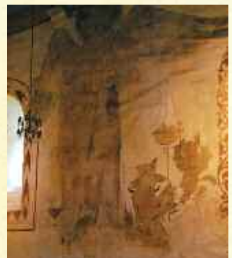
Mikael'smotiv i Kinsarvik kirke (bygget 1160). Mikael med "sjelevekten" er ikke funnet i andre norske kirker.

Det nye i denne Mikaelperioden er at menneskenes erkjennelsesevner – utviklet og styrket gjennom den vitenskapelige tenkning i de siste 4-500 år