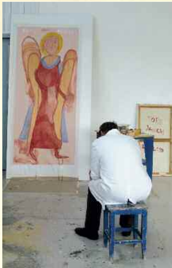
St Mikael, malt av Tore Janicki etter et ikon