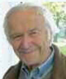
Nils Christie