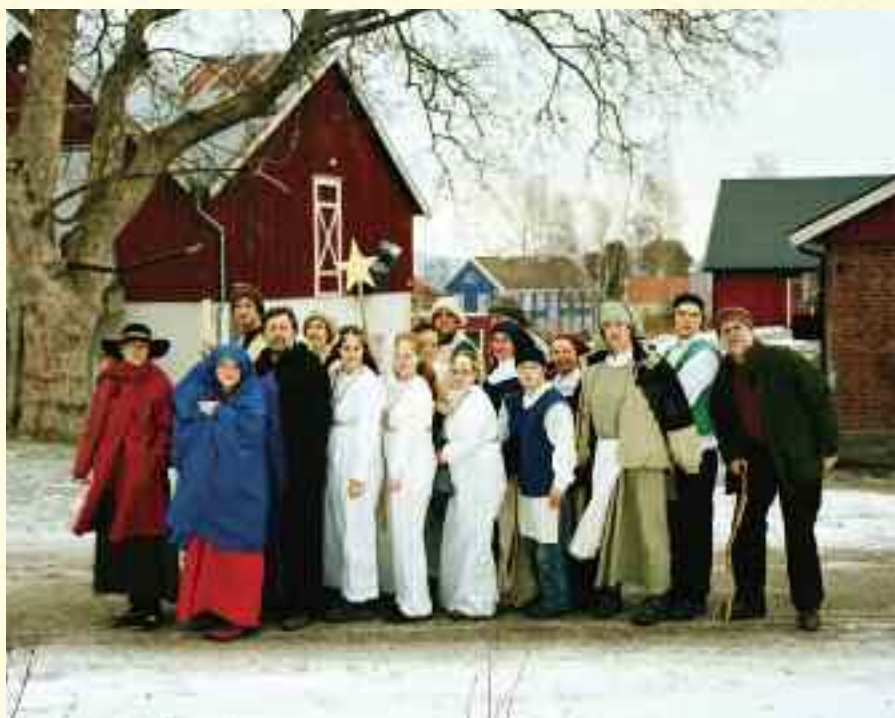
Camphill Rotvoll

Deltagende observasjon er sentralt i Havneraas sin kunstneriske praksis. Havneraas deltar selv i Camphill-landsbyene som aktør i oppsetningene og som betalt arbeider. Dette er minst like viktig for hans praksis som den fysiske produksjonen av kunstverkene.