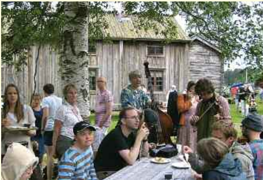
Overalt sitter musikere og spiller sammen eller for hverandre.

"De olympiske Camphill leker" var på programmet. Rett fra høyhustreningen i Mostadmarka dro 10 godt trente trøndere tidlig denne morgen til sportsplassen. Vi trodde først ikke våre øre og øyne men en fullsatt stadion tok oss imot. Og ikke bare svenske eller nordmenn, nei hele