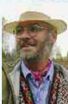
Jan Bang

I "Communities" fant jeg i høst-utgaven 2006 en rekke artikler om og av eldre som bor i kollektiver, fellesskap eller borettslag (cohousing). Her er noen korte sitater.