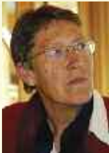
Rigmor Skålholt

"Gjerdrem vil at kontanter skal svi på pengepungen" er å lese i Haugesunds avis 21.5.10. Innskudd og uttak av kontanter i bankene bør koste langt mer enn i dag, mener sentralbanksjef Svein Gjerdrem i