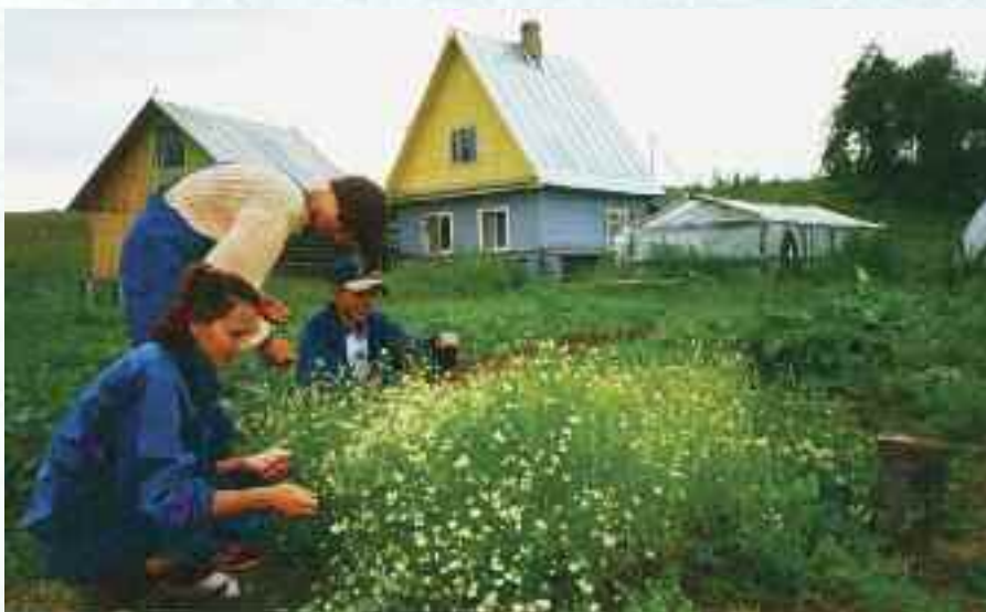
Urteplukking i Svetlana, Russland i 90-årene.

"Det finnes et ridderskap i det 20. århundre. (dette ble skrevet i 1945) Dets medlemmer rir ikke som i tidligere tider gjennom fysiske skogers mørke. De rir gjennom skoger av sinnets mørke. De har en åndelig rust-