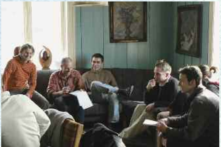
Fra kurs på Fokhol gård, 2007.