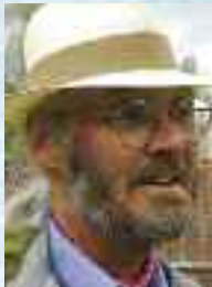
Jan Bang

Blant denne gruppen har de forskjellige medlemmene ulike synspunkter om hva Community innebærer og hvordan Community skal forholde seg til landsbyen og det bredere samfunnet. Hver landsby innenfor