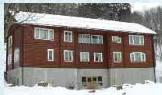
Skolebygningen i dag

I fagbilaget finnes det en mer detaljert omtale av det helsepedagogiske arbeidet på Ljabruskolen. Red.