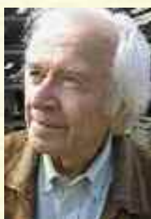
Nils Christie

Fint å møte veiledere om man er gått seg vill. De kan gå foran hjem, vise vei, kanskje redde livet til den villfarne. Men veiledere kan også være til skade. Det gjelder slike som kanskje tar initiativet til turen og så går foran og viser vei til siste slutt. Folk må få en sjanse til å finne sin egen vei. Da kommer de fram med mer kunnskap om både vei og seg selv. Men så kan man gå seg fullstendig fast, da er det godt å ha noen