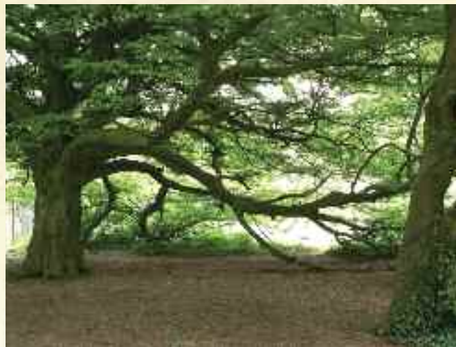
Et levende tre.