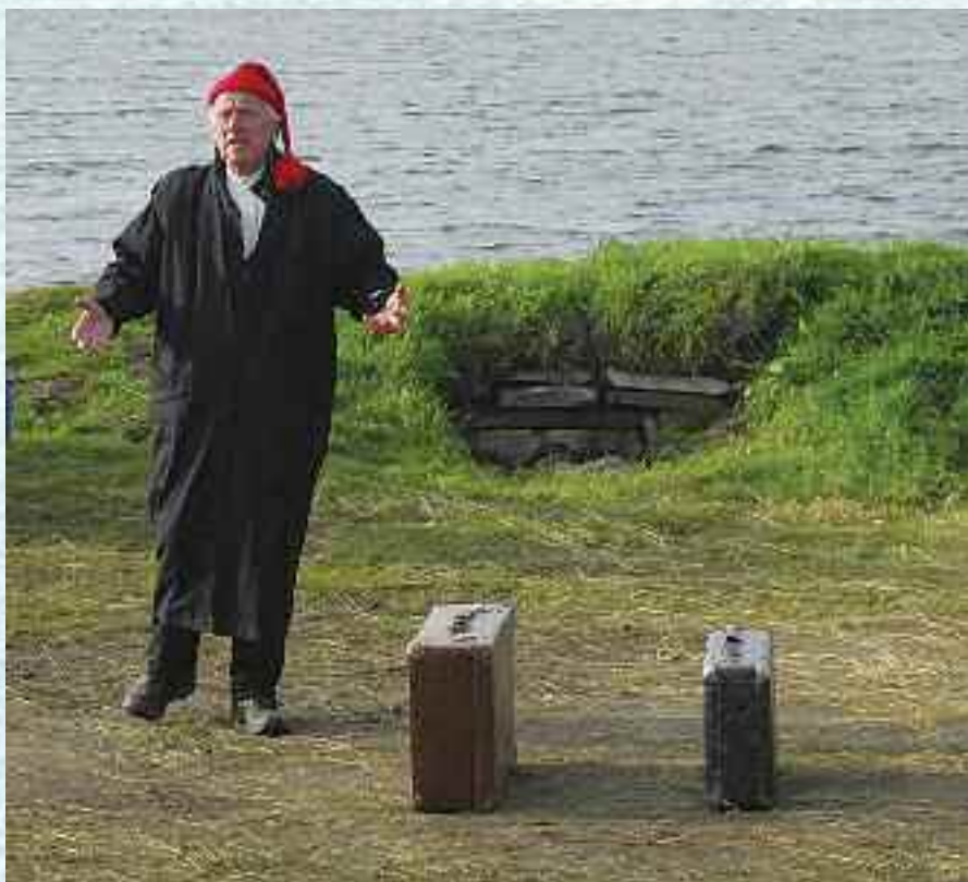
Peer Gynt, Gålå 2009.

Først som en eldre mann kom han tilbake til Norge og til Solveig som tålmodig hadde ventet på Peer hele tiden. Da innså endelig Peer hvor egenrådig og egoistisk han hadde vært. Han hadde vært seg selv nok. Den siste replikken til Peer lyder: «Hvor var jeg meg selv, den hele, den sanne, med Guds stempel på min panne?» Hvorpå Solveig svarer: «I min tro, i mitt håp, i min kjærlighet.»