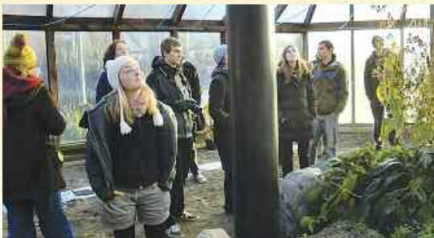
I drivhuset på Solborg.

Hele lørdagen bestod av spørsmål: Hvordan man skal snakke med beboere i forbindelse med empati, sympati og grense? Ved hjelp av