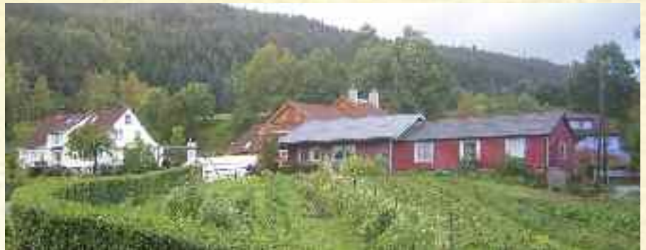
Dyrking på Hogganvik.

Landsbyliv har i flere år hatt et godt samarbeid med tidsskriftet Økologisk Landbruk, se reklamen på side 40 og vi anbefaler våre lesere å abonnere på det for å få en oppmuntring flere ganger i løpet av året.