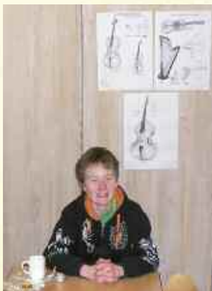
Fredrik vil helst spille tromme

Vi traff Andreas først på lekeplassen, hvor han var opptatt med å dele ut frukt. Andreas går i 7. klasse, men har