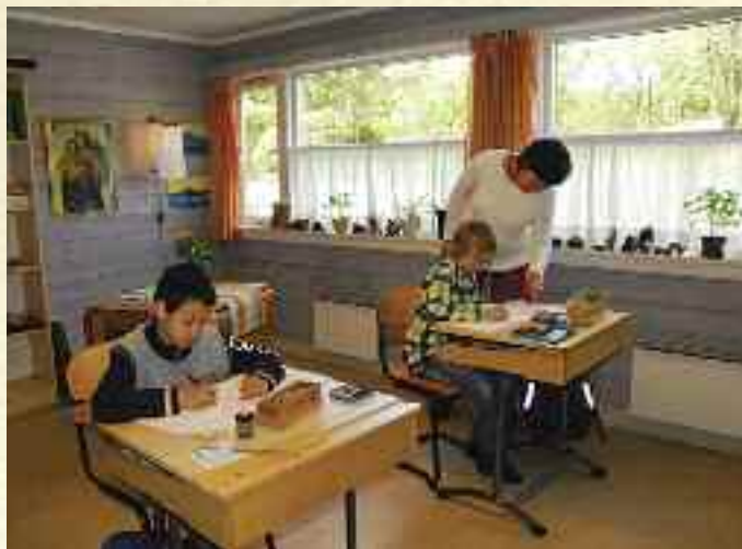
Fra Skjold-skolen.