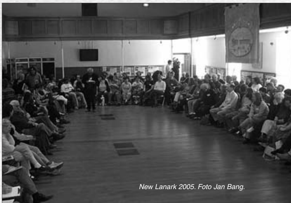
New Lanark 2005.

Dette er resultat av fem års planlegging, og samarbeid med lokale myndigheter er innbakt. Utvidelsen skal skje i faser, hvor hver fase skaper inntekter som hjelper å etablere neste fase. ■■■