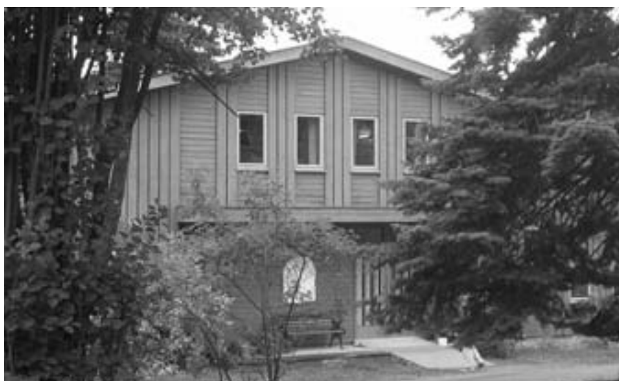
Verkstedbygning på Granly.

Kan det tenkes at disse spesielle samfunnsforholdene i 1930 og -40 årene preget organiseringen og "kulturen som sitter i veggene" så sterkt at vi fortsatt aner restene av det? Edlund stiller spørsmålet, riktignok noe mindre eksplisitt, og gir oss litt å tygge på.